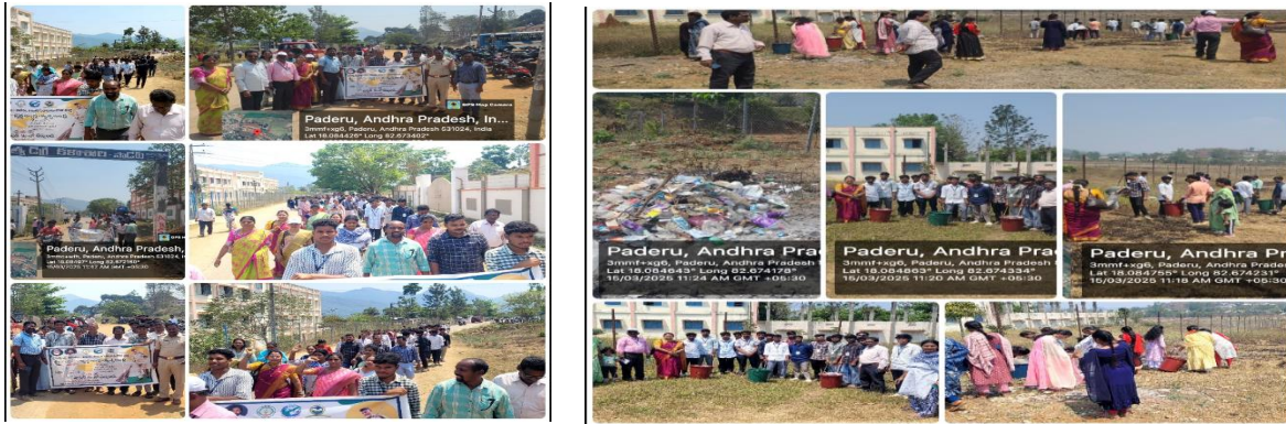
Rally by our staff and students

Swatch Bharat Programme conducted by the NSS UNIT , staff and students